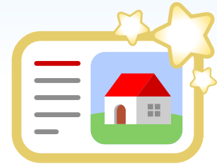
Top & Spezial